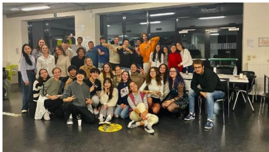
Figure 6、第一次的國際晚餐