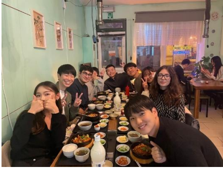
Figure 12、韓國朋友帶我們吃韓式料理