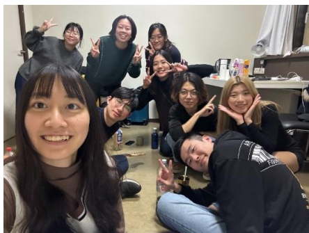
Figure 10、部分臺灣人的聚餐