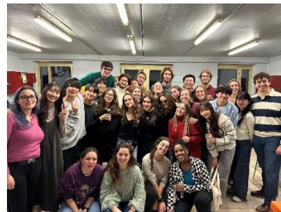
Figure 7、第二次的國際晚餐