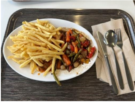
Figure 16、宿舍餐廳基本菜色