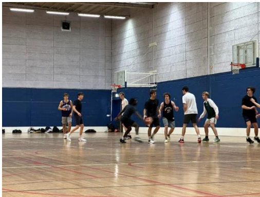
Figure 14、偶爾會跟歐洲朋友去運動場打籃球