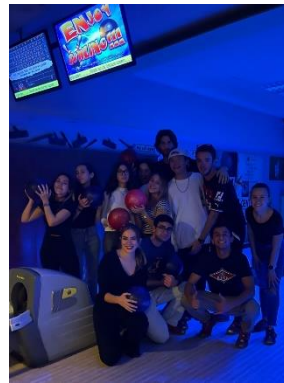
Figure 15、宿舍附近還有地方可以打保齡球