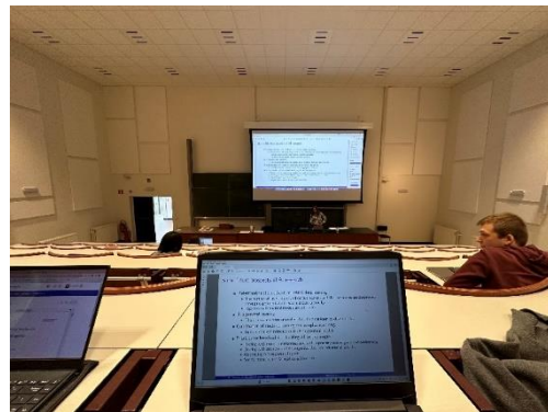
Figure 2、每週就是不停地 coding