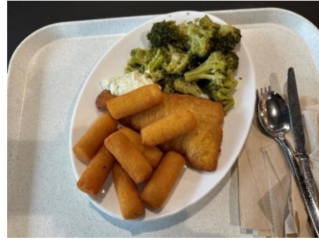
Figure 17、宿舍餐廳基本菜色