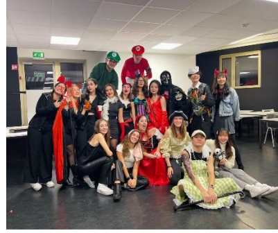
Figure 13、萬聖節大家華麗的裝扮