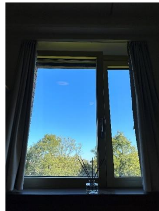
Figure 3、宿舍的擺設以及窗外的美景