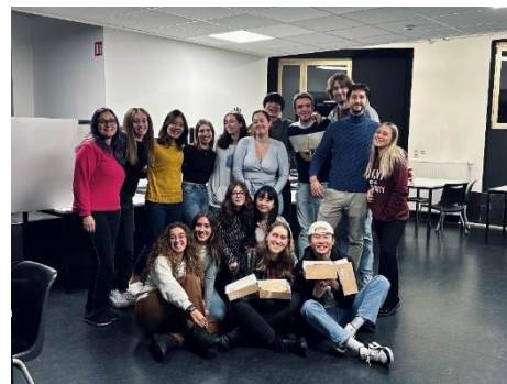
Figure 9、大家幫我慶祝生日