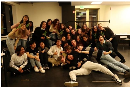
Figure 8、第三次的國際晚餐