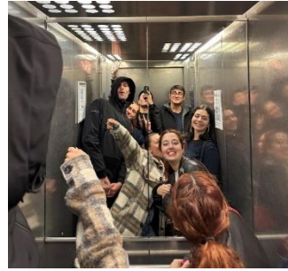
Figure 5、每日必拍的電梯合照