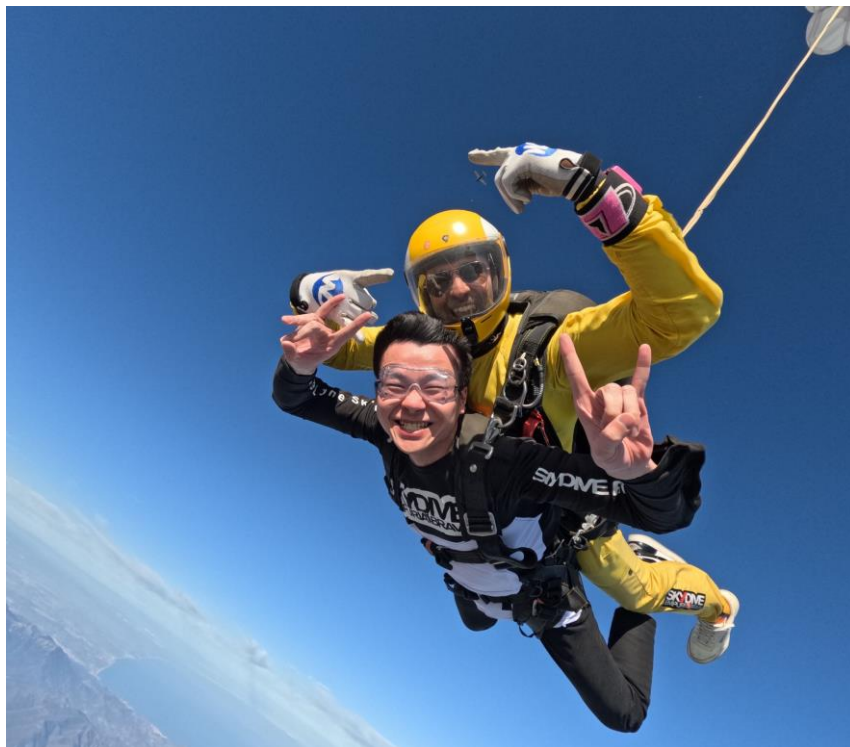
Figure 18、去了歐洲記得要去體驗臺灣沒有的 sky diving

我不知道正在閱讀的你是不是也要展開一個只有屬於自己的異國回憶，但如果你還沒決定要去哪個國家，比利時根特大學將會是你最好的選擇。