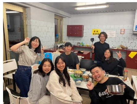
Figure 11、部分臺灣人的聚餐