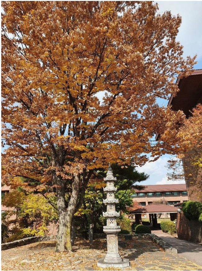
( 校園 )