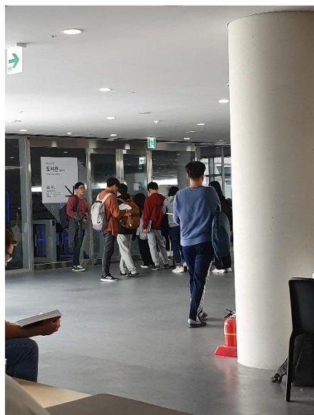
(排隊進圖書館的人潮)

且他們非常重視新創，還有獨立出來的一棟 start-up studio，覺得整體而言，KAIST 是一個非常適合認真做研究、認真念書的地方，資源多，同儕有競爭力，在 KAIST 每一天都過得十分充實。