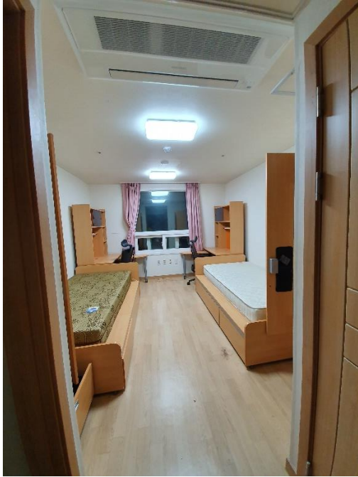
( 宿舍 )