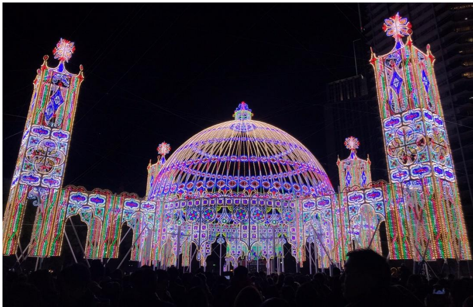
每年12月會舉辦光雕展(神戸ルミナリエ)，為紀念阪神淡路大地震逝去的亡者