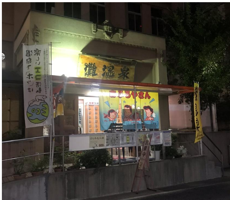
JR 六甲附近的大眾澡堂 (錢湯)，泡澡的好地方

國維寮的房型皆為單人房，空間不大(12 m 2 ) 但有小廚房及衛浴，最近的超市走下山 10 分鐘就有一間，再往下可以到水道筋商店街，有不少販賣便宜食材的店家，若是要採買其他東西，可以選擇 JR 六甲或是搭車到三宮商圈。